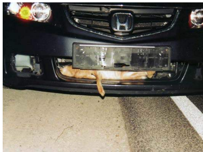
Wildunfälle passieren meist in der Dämmerung