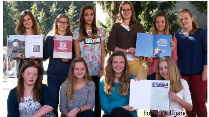
Die stolzen Schülerinnen mit ihrem „Genussbuch“

Am Dienstag, den 23.09.2014 wurde der Oberösterreichische Landespreis für Umwelt und Nachhaltigkeit 2014 im Zuge des Umweltkongresses im Linzer Schlossmuseum an unsere Schule verliehen. Dieser Preis ist die offizielle Auszeichnung Oberösterreichs für Menschen und Einrichtungen, die sich um eine zukunftsfähige Entwicklung unseres Landes im Bereich Umwelt und Nachhaltigkeit verdient gemacht haben.