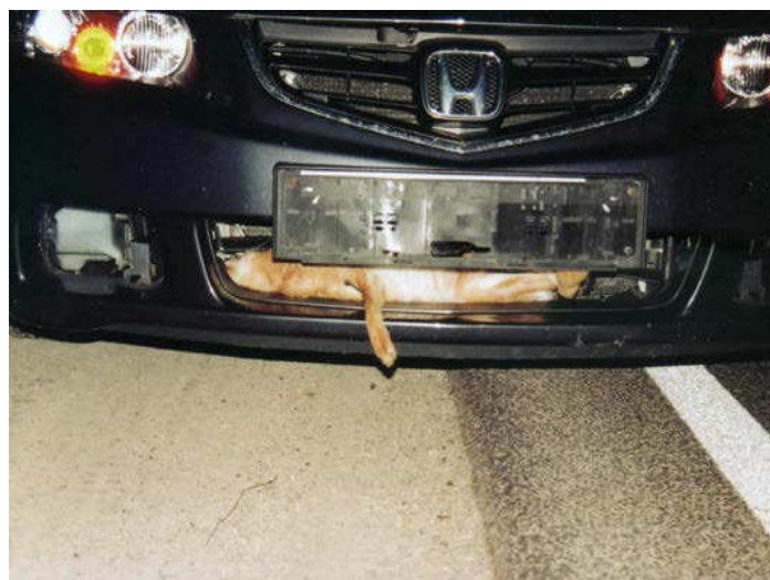
Wildunfälle passieren meist in der Dämmerung