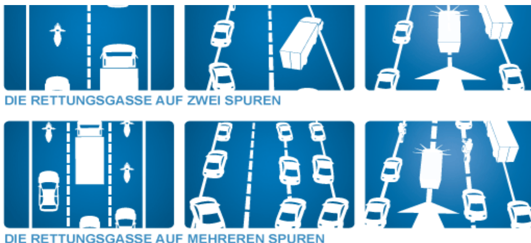
DIE RETTUNGSGASSE AUF ZWEI SPUREN

Fahrzeuglenker werden verpflichtet bei Stocken des Verkehrs eine Gasse zu bilden, um Einsatzfahrzeugen die Durchfahrt zu ermöglichen.