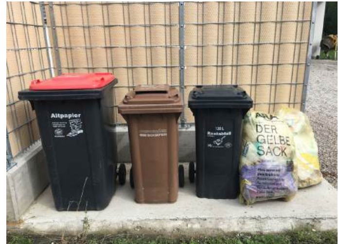
Ein sauberer Abfallplatz motiviert zur richtigen Trennung

Der Bezirksabfallverband Wels-Land informiert über alle Neuerungen in der Verpackungssammlung unter www.umweltprofis.at/wels-land